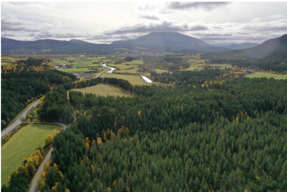
Østerdalsporten Nord